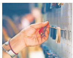
Freitag ist mehr als ein Wochentag: Das Unternehmen fertigt hochwertige und stylische Taschen und Accessoires aus LKW-Planen.

Mehr Infos: LHS Saarbrücken, Frauenbüro, Telefon: (0681) 905-1649, E-Mail: frauenbuero@saarbruecken.de , Internet: www.frauenbuero.saarbruecken.de .