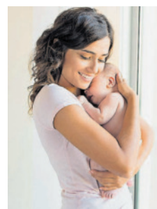
Der neue Flyer zeigt Orte in der City, wo Mütter ihre Babys stillen und wickeln können.

Der Flyer ist beim Saarländischen Hebammenverband, bei City Marketing, im Rathaus St. Johann (Infotheke und Frauenbüro) und an vielen weiteren Orten in Saarbrücken erhältlich. Auch online können sich Familien sowohl vorab als auch unterwegs darüber informieren, in welchen Geschäften in der Innen-