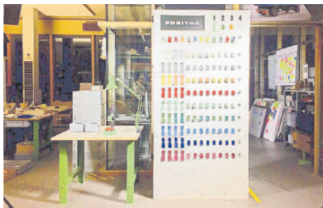
Leder Spahn baut für Sie eine kleine Werkstatteinheit auf. Dann legen Sie los!

Auch abgesehen davon können Sie derzeit die ganze Vielseitigkeit von Freitag bei Leder Spahn bewundern. Gezeigt wird die große, weite Welt von Planen und Farben in Form von hochwertigen, einzigartigen und zeitlos schönen Taschen: Bewundern, fühlen, umhängen und lieb gewinnen!