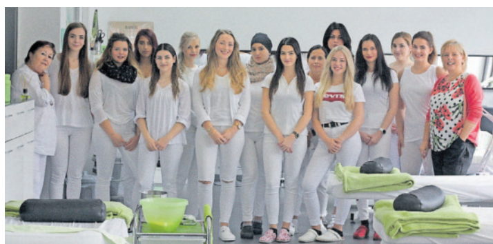
Schöne Aussichten: Die Schülerinnen mit ihren Lehrerinnen im Behandlungsraum der Saarbrücker Kosmetikschule.

Kosmetikschule Vogelgesang Einjährige Berufsfachschule Sulzbachstraße 20 (gegenüber dem Beethovenplatz) 66111 Saarbrücken Telefon: (0681) 4 17 21 70 E-Mail: info@kosmetikschule-vogelgesang.de Internet: kosmetikschule-vogelgesang.de